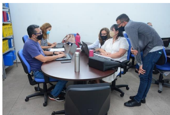
EQUIPE DE FORMADORES – CAAED/SEMED

As ações desenvolvidas nesse programa visam garantir a formação continuada para os profissionais do magistério e demais categorias da Educação Infantil, em especial a formação continuada em serviço, proporcionando a valorização dos profissionais e a reflexão da prática pedagógica, contribuindo para a melhoria da qualidade do ensino e da aprendizagem das crianças da Educação Infantil.