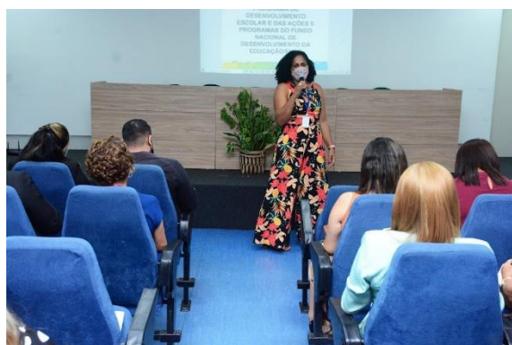
FORMAÇÃO CONTINUADA DE GESTORES – PROGRAMA PDDE

A formação continuada em serviço é uma ação que contribui para manutenção da qualidade do ensino e aprendizagem dos estudantes do Ensino Fundamental e por isso ela é necessária ao processo de atualização e capacitação do profissional do magistério.