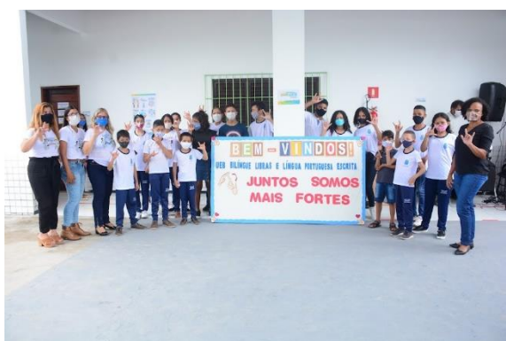
ESCOLA MUNICIPAL BILÍNGUE

Em 2021, o atendimento aos estudantes público-alvo da Educação Especial na Rede Pública Municipal de Ensino de São Luís foi de 2.817 estudantes matriculados em classe comuns, 82 na escola bilíngue (Libras e Língua Portuguesa) e 1.292 em salas de recursos multifuncionais, conforme especificado a seguir: