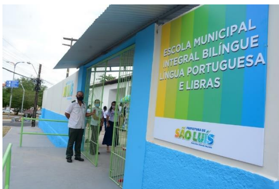
INAUGURAÇÃO DA ESCOLA MUNICIPAL BILÍNGUE

A Educação Especial se constitui numa modalidade de ensino que perpassa todos os níveis, etapas e modalidades, tendo como objetivo assegurar o acesso, a participação e a aprendizagem dos estudantes com deficiência, transtornos globais do desenvolvimento e altas habilidades/superdotação, garantindo o Atendimento Educacional Especializado - AEE, operacionalizado nas Salas de Recursos Multifuncionais, permitindo-lhes plena participação e acesso aos recursos técnico-pedagógicos, eliminando barreiras de acesso ao ensino, considerando suas necessidades educacionais específicas.