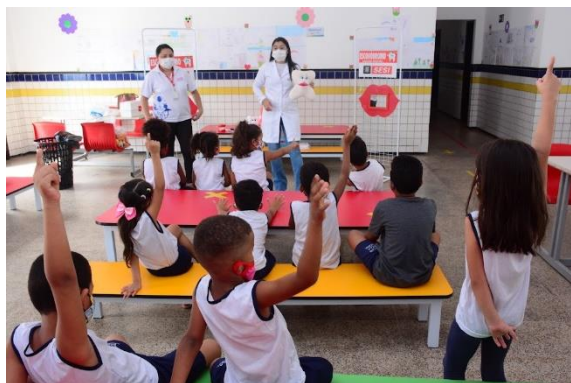
PROGRAMA DE HIGIENE BUCAL – PARCERIA COM O SESI

A Secretaria Municipal de Educação de São Luís – SEMED tem a responsabilidade de oferecer uma educação de qualidade social, comprometida com a aprendizagem significativa e integral das crianças, jovens, adultos e idosos, no âmbito de educação básica, visando a garantia de direitos ao conjunto orgânico e progressivo de suas aprendizagens.