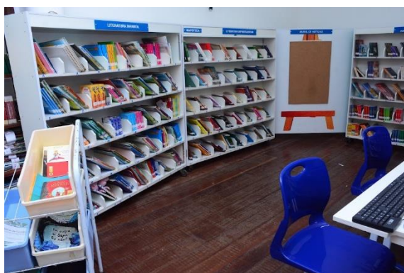
BIBLIOTECA DA UEB ALBERTO PINHEIRO