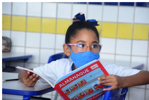
ENTREGA DE ALMANAQUE – PROGRAMA TRILHOS DA ALFABETIZAÇÃO

Face ao exposto, a Prefeitura por intermédio da SEMED, firmou parcerias com diversas instituições com vista a oferta de ações educativas no âmbito da Rede Pública Municipal de Educação de São Luís, dentre as quais explicitamos: