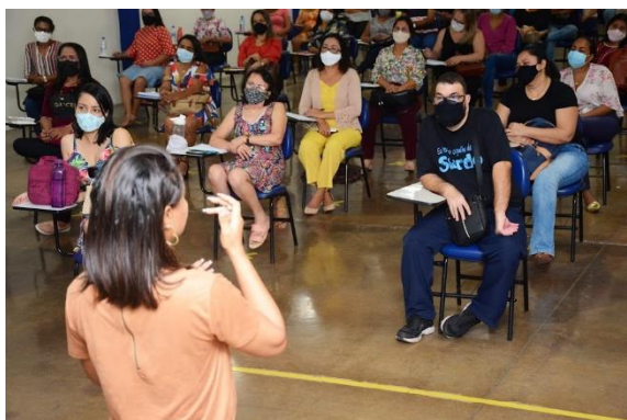
FORMAÇÃO CONTINUADA DE PROFESSORES – SALA DE RECURSO MULTIFUNCIONAL

A oferta de formação dos profissionais do Magistério e demais categoria da Educação Especial tem como fim precípua o aperfeiçoamento do corpo docente e suporte à docência, aliado à valorização profissional, como forma de alcançar uma educação inclusiva e de equidade, com atendimento às necessidades dos alunos da EE, com os seguintes resultados em 2021: