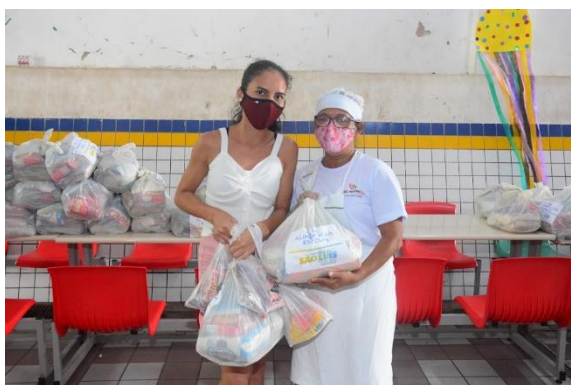
ENTREGA DE KITS DE ALIMENTAÇÃO – UEB MONSENHOR FREDERICO CHAVES

Em razão da pandemia da Covid-19, as aulas presenciais na Rede Municipal de Ensino de São Luís, foram suspensas desde 18 de março de 2020, causando o afastamento imediato dos professores e estudantes do espaço escolar. Em 2021, a Secretaria Municipal de Educação deu início ao ano letivo nas Unidades de Educação Básica no dia 1º de março ainda de forma remota.