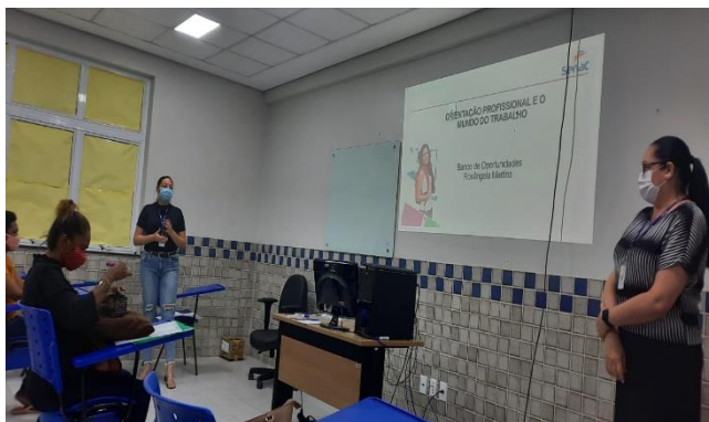
INICIAÇÃO A FORMAÇÃO PROFISSIONAL – UEB ALBERTO PINHEIRO

A Educação de Jovens e Adultos, é uma modalidade de ensino integrante da educação básica, que tem grande relevância por investir na garantia do direito social à educação de todos aqueles que não tiveram acesso ou não puderam dar continuidade aos estudos na idade própria.