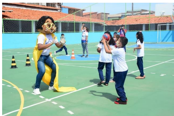
UEB ALBERTO PINHEIRO

As ações desenvolvidas nesse programa visam garantir a realização dos programas e projetos didático-pedagógicos no Ensino Fundamental, com prioridade para o ensino, a aprendizagem, proporcionando o desenvolvimento físico, psicológico, intelectual e social dos estudantes do Ensino Fundamental, consolidando direitos e complementando a ação da família e da comunidade local.