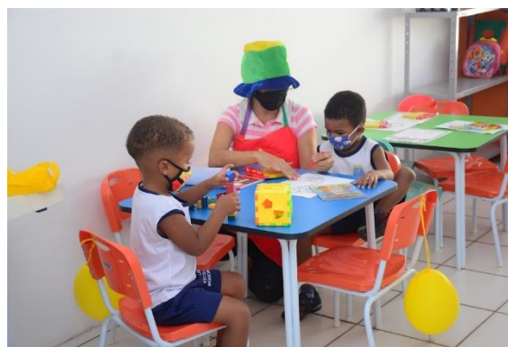
UEB MIGUEL LINS

O Programa de Educação Infantil visa a ampliação gradativa do atendimento em creches para as crianças de 6 meses até 3 anos de idade, a universalização do atendimento na faixa etária de 4 a 5 anos em pré-escolas, ampliando seu tempo de permanência nas instituições de ensino, com vistas a assegurar o direito das crianças a uma educação pública municipal inclusiva, sustentável e de qualidade social, facilitando e promovendo o acesso e a permanência dos pais ou responsáveis no mundo do trabalho e a valorização dos profissionais da Educação Infantil.