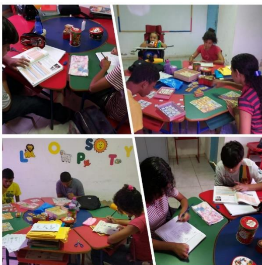
SALA DE RECURSO MULTIFUNCIONAL