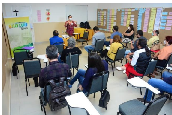
FORMAÇÃO CONTINUADA DE TÉCNICOS DA SEMED – PLANEJAMENTO ESTRATÉGICO

Constitui-se um dos principais direitos dos educadores, conforme disposto na Lei de Diretrizes e Bases da Educação - LDB 9394/96, reafirmada no Plano Municipal de Educação – PME. É parte integrante do exercício profissional, tanto para os profissionais do magistério, como para as demais categorias, e tem suas ações planejadas e implementadas em um plano de trabalho crítico-reflexivo, considera os resultados obtidos nos exames SAEB e Simae, alinha-se com a BNCC e com a Proposta Curricular da Rede e no compromisso coletivo de uma formação sólida e efetiva, da igualdade de oportunidades para todos os profissionais.