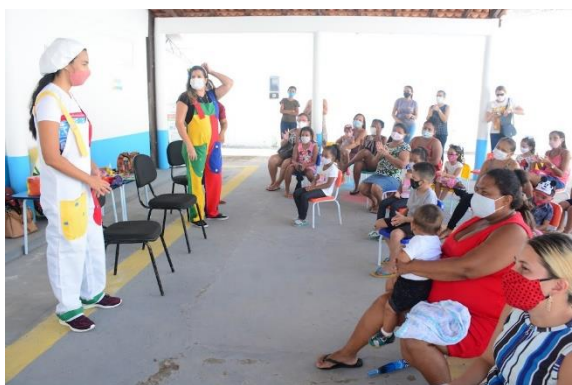
ACOLHIMENTO ÀS FAMÍLIAS - UEB MIGUEL LINS

Em parceria com a UNICEF, a Semed realizou ações durante todo o ano para a manutenção e ampliação dos vínculos dos estudantes com as escolas. Por meio do Programa Busca Ativa Escolar e com a aproximação das equipes escolares das famílias, foi possível superar e ter êxito.