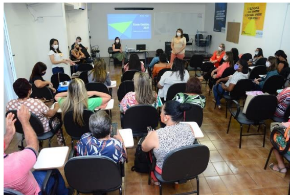
FORMAÇÃO CONTINUADA DE GESTORES – PROGRAMA ECOA GESTÃO