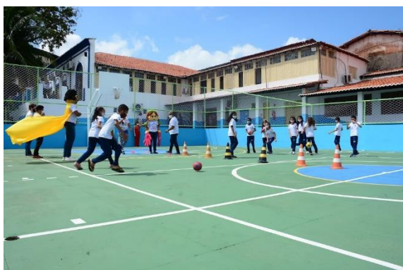
UEB ALBERTO PINHEIRO

Além dos estudantes, o Programa Ensino Fundamental oferecido pela Rede Pública Municipal de Educação, tem como público alvo a comunidade local, a equipe escolar formada por professores, gestores escolares, professores suporte pedagógico e servidores: administrativos, técnicos e operacionais, valorizando os seus profissionais de maneira mais abrangente, com uma nova perspectiva de gestão pública da Educação.