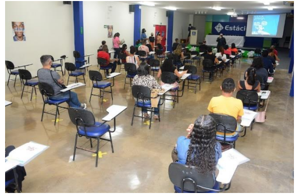
FORMAÇÃO DE CUIDADORES ESCOLARES