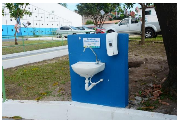
ESTAÇÃO DE LAVAGEM DE MÃO – UEB RONALD CARVALHO