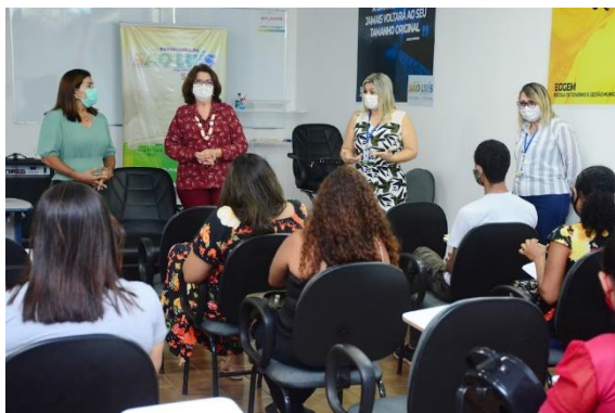
FORMAÇÃO ESCOLAS COMUNITÁRIAS

aperfeiçoamento do pessoal docente e demais profissionais da educação.