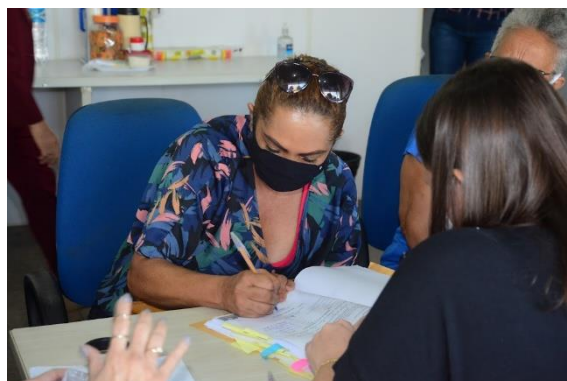
CONVÊNIOS COM AS ESCOLAS COMUNITÁRIAS

Até 31 de agosto, 144 escolas comunitárias firmaram termo de colaboração com a Secretaria Municipal de Educação para o recebimento de recursos do FUNDEB, conforme expressa a tabela a seguir: