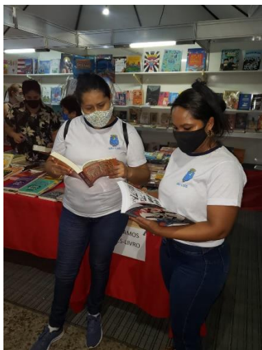
14ª FEIRA DO LIVRO DE SÃO

A realização dos programas e projetos didático-pedagógicos na educação de jovens, adultos e idosos atendidos pela Rede foram implementadas de acordo com os componentes curriculares da modalidade, em suas respectivas áreas de conhecimento, tendo como prioridades o ensino e a aprendizagem, o desenvolvimento físico, psicológico, cultural, intelectual e social, tendo em vista o favorecimento da inserção ao mundo do trabalho.