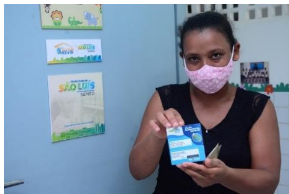
ENTREGA DO CARTÃO ALIMENTAÇÃO – UEB ELZAMARIA

No dia 13 de dezembro, deu-se início a entrega do cartão nas escolas aos responsáveis dos alunos no valor de R$ 400,00 reais com prazo de 210 dias para uso do crédito do cartão na rede credenciada com mais de 250 estabelecimentos comerciais.