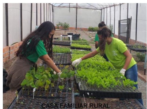
CASA FAMILIAR RURAL

Por meio da Escola Casa Familiar Rural, há ainda a oferta de atendimento voltado à realidade do homem do campo onde é desenvolvida a pedagogia da alternância, que se constitui em um