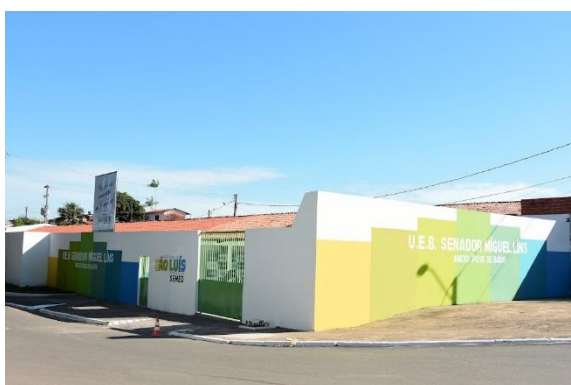
UEB SENADOR MIGUEL LINS – ANEXO IPASE DE BAIXO

Por meio do Programa Escola Nova, ao longo de 2021, várias escolas foram reformadas para garantir o retorno seguro de alunos, profissionais e toda comunidade escolar às salas de aulas, recebendo todas as intervenções estruturais necessárias e sendo adaptadas aos novos protocolos sanitários.