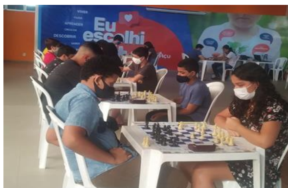
ESTUDANTES DO NEECAHS – CAMPEONATO DE XADRF7

As ações desenvolvidas neste programa visam garantir a realização dos programas e projetos didático-pedagógicos na Educação Especial.